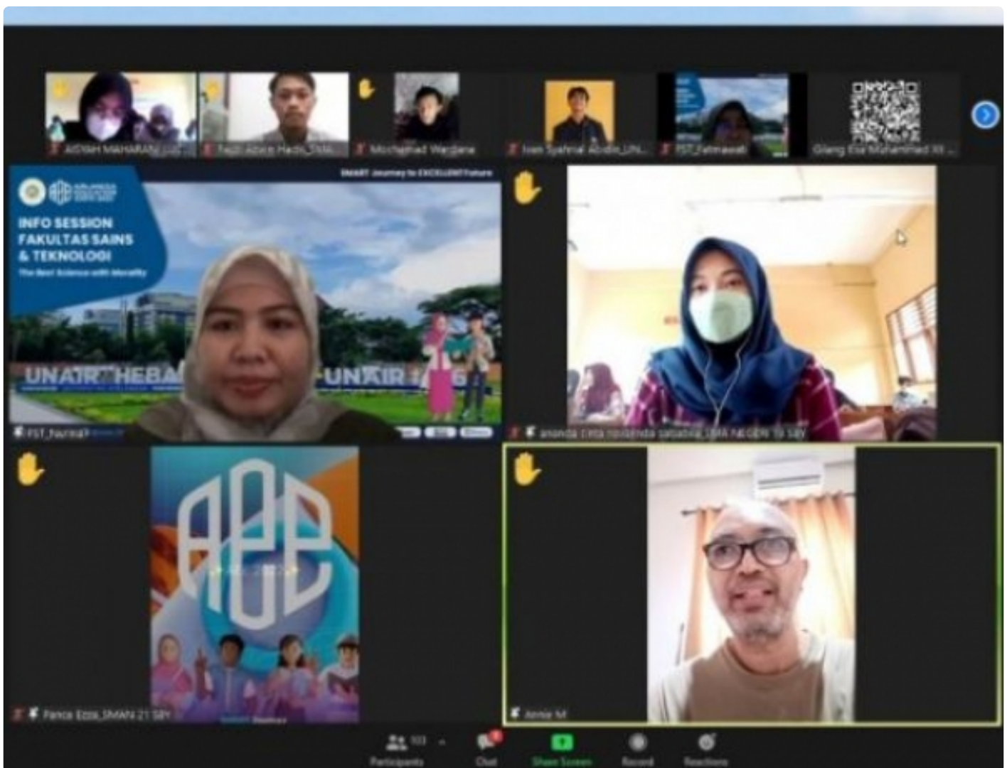
Sesi Tanya Jawab bersama FST UNAIR